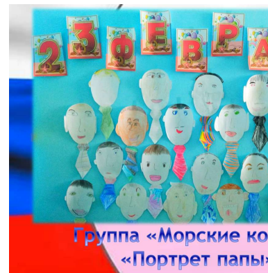
Группа «Морские ко «Портрет папы»

Каждый год в нашем детском саду «Радуга» проходит тематическая неделя к празднику "День Защитника Отечества". В течение недели во всех возрастных группах проводятся различные мероприятия: чтение художественной литературы, беседы, рассматривание иллюстраций по теме, просмотр слайдов, отгадывание загадок о военной технике, о разных родах войск, рисование, лепка по теме. С большим интересом воспитанники с помощью воспитателей изготавливают из разного материала подарки для любимых пап, дедушек, старших братьев. Воспитателями был оформлен стенд детских рисунков «Портреты пап», «Военная техника», «Поздравительные газеты и плакаты». Каждая группа проявила свое творчество и фантазию при создании стенгазет.